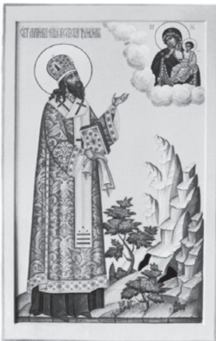
Тропарь, глас 8

Православия ревнителю и раскола искоренителю, Российский целенниче и новый к Богу молитвенниче, списаньми твоими буих уцеломудрил еси, цевнице духовная, Димитрие блаженне, моли Христа Бога спастися душам нашим.